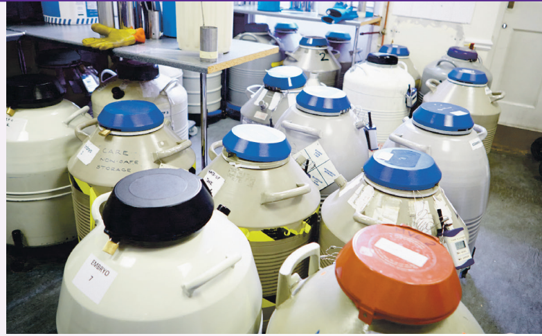
C'est dans de tels conteneurs que seront bientôt conservés des centaines de milliers d'embryons pour une durée de dix ans. Et après, qu'advient-il d'eux?

Le DPI est un pas vers une technique de procréation dénuée de limites. La prochaine étape sera le «Designer-Baby» (bébé sur mesures), celle d'après, le «bébé thérapeutique» (produire un bébé qui sera utilisé pour en soigner un autre).